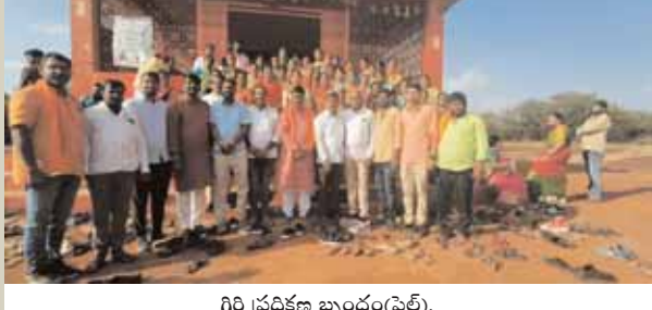
గిరి ప్రదక్షిణ బృందం(ఫైల్).

వికారాబాద్ జిల్లా కేంద్రంలోని అనంతగిరి లోగల ప్రముఖ శ్రీ అనంత పద్మనాభ స్వామి దేవాలయ పరిరక్షణే తమ ముఖ్య ఉద్దేశమని భారతీయ జనతా పార్టీ