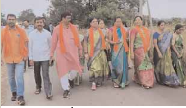
గిరి ప్రదక్షిణలో పాల్గొన్న మహిళ భక్తులు(ఫైల్).