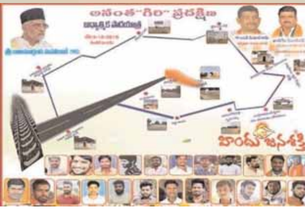
గిరి ప్రదక్షిణ రూట్ మ్యాప్.