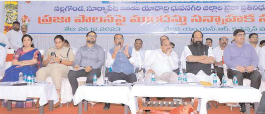
నల్లగొండ జిల్లా బ్యూరో

రోడ్లు, భవనాల శాఖా మంత్రి కోమటిరెడ్డి వెంకటరెడ్డి