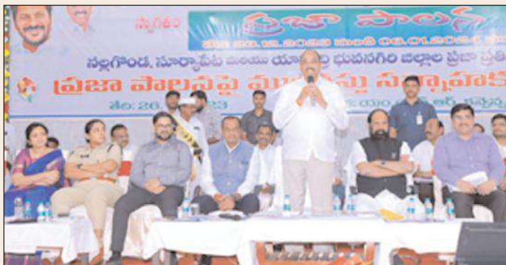
ఉమ్మడి జిల్లా బ్యూరో

రాష్ట్ర వ్యవసాయ, మార్కెటింగ్, సహకార, చేనేత, జౌళీ శాఖా మంత్రి, ఉమ్మడి నల్లగొండ జిల్లా ఇన్చార్జ్ మంత్రి తుమ్మల నాగేశ్వరరావు