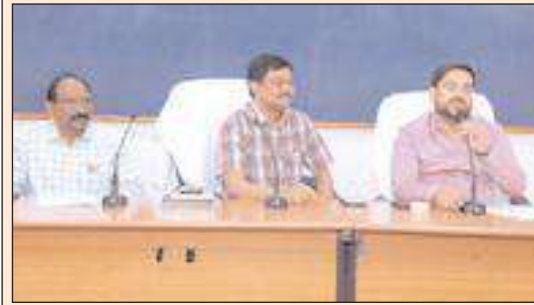
నల్లగొండ జిల్లా బ్యూరో

బుధవారం కలెక్టరేట్ సమావేశం ముగిసిన పోటీ చేసిన అభ్యర్థులు, ఏజెంట్లు, సహాయ వ్యయ పర్యవేక్షణ అధికారులు, అకౌంటింగ్ టీమ్ లతో సమావేశం నిర్వహించారు. ఈ సందర్భంగా ఆయన మాట్లాడుతూ సాధారణ ఎన్నికల నిర్వహణలో భాగంగా పోటీ చేసిన అభ్యర్థుల ప్రతిరోజు నిర్వహించిన అకౌంట్స్ రిజిస్టర్లు, క్యాంప్ రిజిస్టర్లు, బ్యాంక్ రిజిస్టర్లు, సమగ్ర