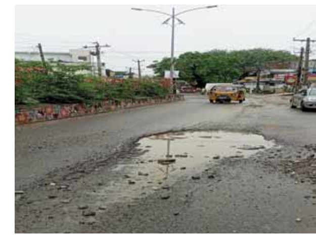
అని పలువురు ప్రశ్నిస్తున్నారు. మరి ఏవిధంగా స్పందిస్తారో చూడాలి ఉంది.