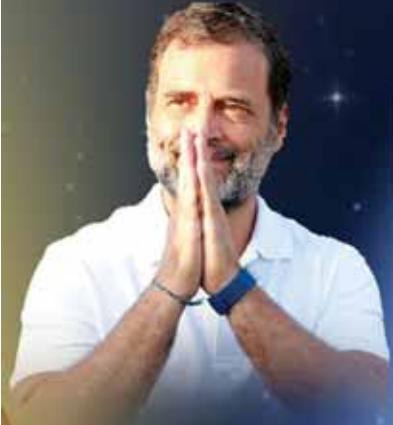
Shri Rahul Gandhi Ji