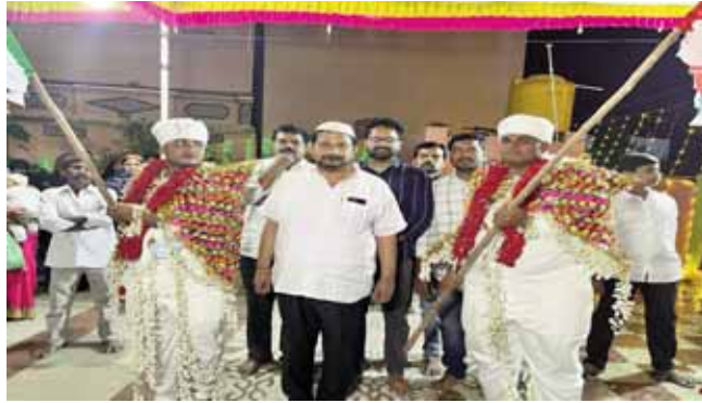
వైభవంగా జెండాల ఉత్సవం.