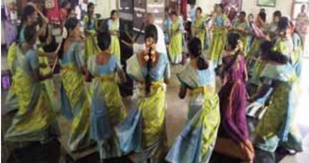
వింజమూరు మేజర్ న్యూస్ వింజమూరు లోని శ్రీ వేదవ్యాసా వశిష్ట పిరమిడ్ ధ్యాన మహా శక్తి క్షేత్రం నందు కోలాట ప్రదర్శనతో, చక్కటి ఆధ్యాత్మిక గీతాలతో పిరమిడ్ దద్దరిల్లిపోయింది. అందరినీ కనులవిందుగా వారి