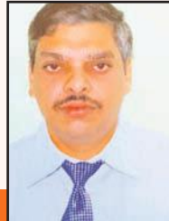
- డా॥ వి. సతీష్

దక్షిణాఫ్రికా పర్యటనలో భాగంగా జరిగిన మూడు మ్యాచ్ లో టీ20 సిరీస్ ను 1-1తో టీమిండియా సమం చేసింది. మొదటి మ్యాచ్ వరల్డ్ కారణంగా రద్దు కాగా రెండవ మ్యాచ్ లో దక్షిణాఫ్రికా గెలిచింది. నిర్ణయాత్మక 3వ మ్యాచ్ లో టాస్ ఓడి మొదట బ్యాటింగ్ కు దిగిన భారత్ నిర్ణీత 20 ఓవర్లలో 7 వికెట్ల నష్టానికి 201 పరుగులు చేసింది. కెప్టెన్ సూర్యకుమార్ యాదవ్ (56 బంతుల్లో 100, 7 ఫోర్లు, 8 సిక్సర్లు) నాలుగో సెంచరీ నమోదు చేసుకోగా.. యశస్వి జైస్వాల్ (41 బంతుల్లో 60, 6 ఫోర్లు, 3 సిక్సర్లు) అర్ధశతకంతో రాణించాడు. లక్ష్యచేదనలో దక్షిణాఫ్రికా 13.5 ఓవర్లలో 95 పరుగులకు ఆలోచించి, సూర్యకుమార్ కు 'షేయర్ ఆఫ్ ది సిరీస్' తో పాటు 'మ్యాచ్ ఆఫ్ ది మ్యాచ్' దక్కింది. అంతర్జాతీయ టీ20లో సూర్యకుమార్ కు ఇది నాలుగో సెంచరీ. టీ20లో నాలుగు సెంచరీలు చేసిన మ్యాక్స్ వెల్, రోహిత్ శర్మ సరసన సూర్యు చేరాడు.