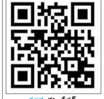
సూర్య ఈ - పేపర్