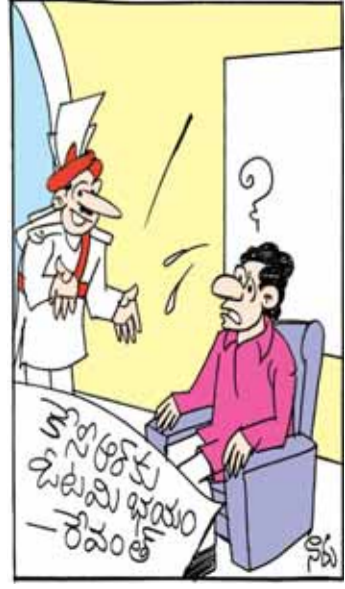
ఇక ఓటర్లకు భయపడాల్సిన పనేం ఉంది సార్ మనకు