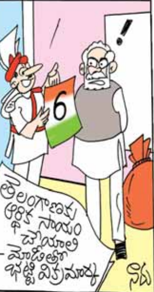
గ్యారంటీలు వాళ్లని నిధులేమో మనవి సార్

● ప్రభుత్వ ఆసుపత్రులలో ప్రసవాల సంఖ్య పెరిగేలా అధికారులు సమర్థవంతంగా కృషి చేయాలి ● పల్లె దవాఖాన, బస్టి దవాఖానల పనితీరు మెరుగుపరుచుకోవాలి ● మాత శిశు సంరక్షణకు పెద్దపీట వేయాలి ● అర్బులైన నర్సులకు మిడ్ వైఫలీ ట్రైనింగ్ ఇచ్చి సహజ డెలివరీలు జరిగేలా వైద్య, ఆరోగ్య శాఖ అధికారులు చొరవ చూపాలి ● టీబీ, కుష్టు వ్యాధి నివారణకు చర్యలు చేపట్టాలి ● గ్రామ సభల ద్వారా అవగాహన నిర్వహించాలి ● నేషనల్ హెల్త్ మిషన్ పై ఉన్నత స్థాయి సమీక్షలో రాష్ట్ర వైద్య, ఆరోగ్య కుటుంబ సంక్షేమ శాఖ మంత్రి దామోదర రాజనర్సింహ అధికారులకు ఆదేశం