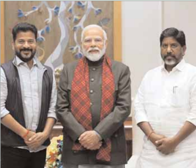
తెలంగాణలో కొత్త ప్రభుత్వం కొలువు దీరిన తర్వాత ముఖ్యమంత్రి, ఉప ముఖ్యమంత్రి తొలిసారిగా దిల్లీలో ప్రధానమంత్రి నరేంద్ర మోదీని ఆయన నివాసంలో మంగళవారం సాయంత్రం మర్యాదపూర్వకంగా కలిశారు. ఈ సందర్భంగా రాష్ట్రానికి సంబంధించిన పలు సమస్యలను వారు ప్రధానమంత్రి దృష్టికి తీసుకెళ్లారు.

● తెలంగాణలో కొత్త ప్రభుత్వం ఏర్పాటైన తరువాత తొలిసారి ప్రధానితో సమావేశం ● విభజన హామీలు, పిండింగ్ నిధులపై చర్చ? ● వివిధ అంశాలపై ప్రధానికి నివేదిక ఇచ్చిన ముఖ్యమంత్రి రేవంత్ రెడ్డి, ఉప ముఖ్యమంత్రి మల్లు భట్టి విక్రమార్క