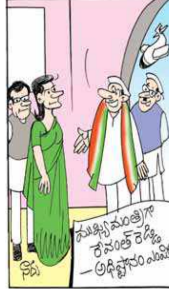
మొత్తానికి ఏ చిట్టెలు తీయకుండానే ఇలా కానిచ్చేసాం మేడం