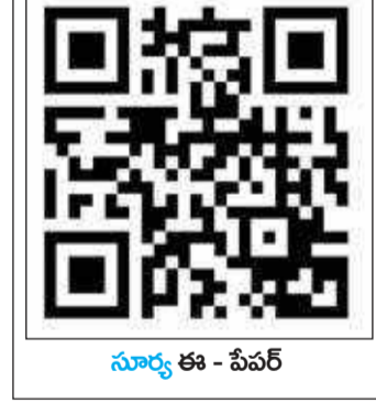
సూర్య ఈ - పేపర్