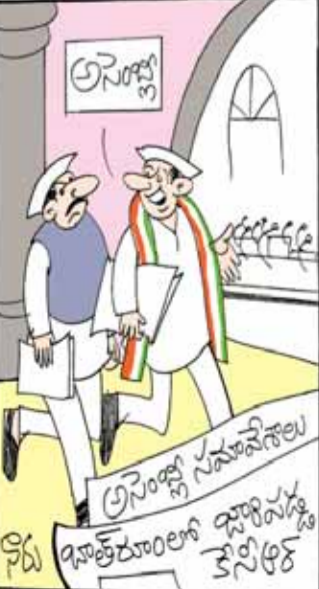
జీజీపీ సభ్యుల్లాగే సభకు జీఆర్ఎస్ వాళ్ళూ డుమ్మా కొడతారేమో