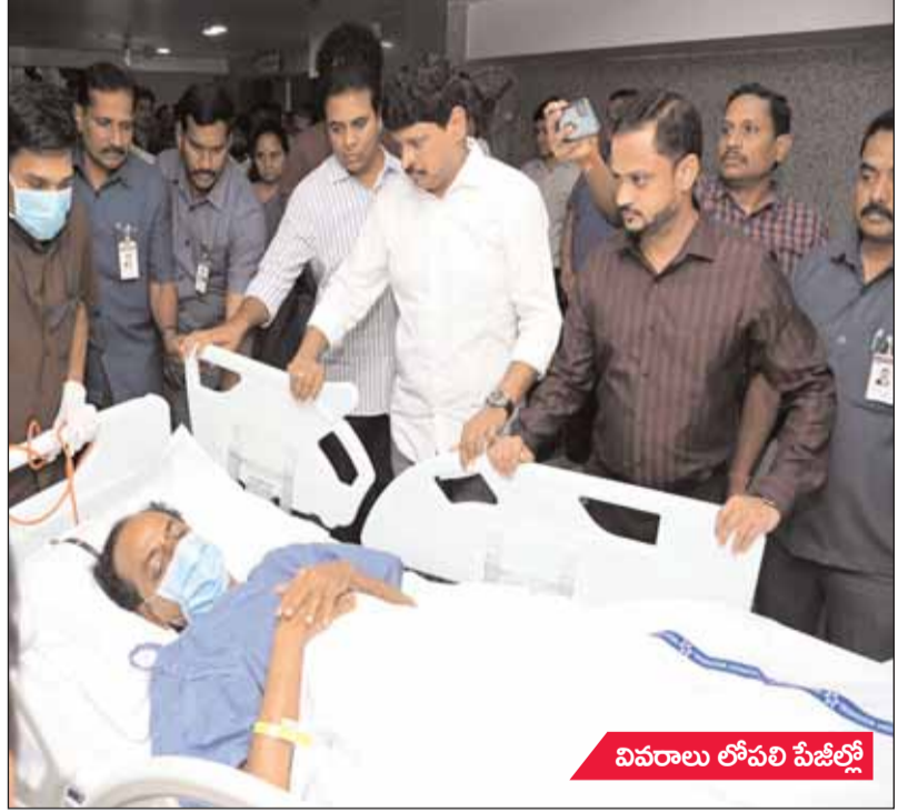
వివరాలు లోపలి పేజీల్లో