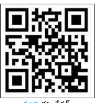
సూర్య ఈ - పేపర్