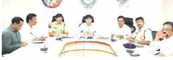
తుఫాను ప్రభావం తగ్గిన తర్వాత అందరికీ రేషన్ అందజేయాలని కార్య కేకపోయినప్పటికీ రేషన్ అందించాలని ఆదేశించారు.

అనకాపల్లి, డిసెంబర్ 6, మేజర్ న్యూస్: జిల్లా కలెక్టర్ శెట్టిలోని మండల ప్రత్యేక అధికారులు తాసిల్దార్లు ఎంపీడీవోలతో వెబ్ ఎక్స్ నిర్వహించారు. కలెక్టర్ మాట్లాడుతూ ఈ రోజు రేపు కూడా అప్రమత్తంగా ఉండాలని, సహాయ కార్యక్రమాల నిరంతరం కొనసాగాలని ఆదేశించారు. లోతట్టు ప్రాంతాల వారికి పరిస్థితిని వివరించి శిబిరాలకు చేర్చాలన్నారు. శిబిరాలలో పూర్తిస్థాయి ఏర్పాట్లు, నాణ్యమైన ఖోజాలు అందాలన్నారు. ఎవరికైనా అనారోగ్య సమస్యలు అయితే వెంటనే వైద్య శిబిరాలకు తరలించాలన్నారు. ప్రజలకు ద్వైరం చెప్పి పూర్తిగా వరద ప్రభావం తగ్గిన తరువాతే వారి ఇంటికి పంపించాలని ఆదేశించారు.