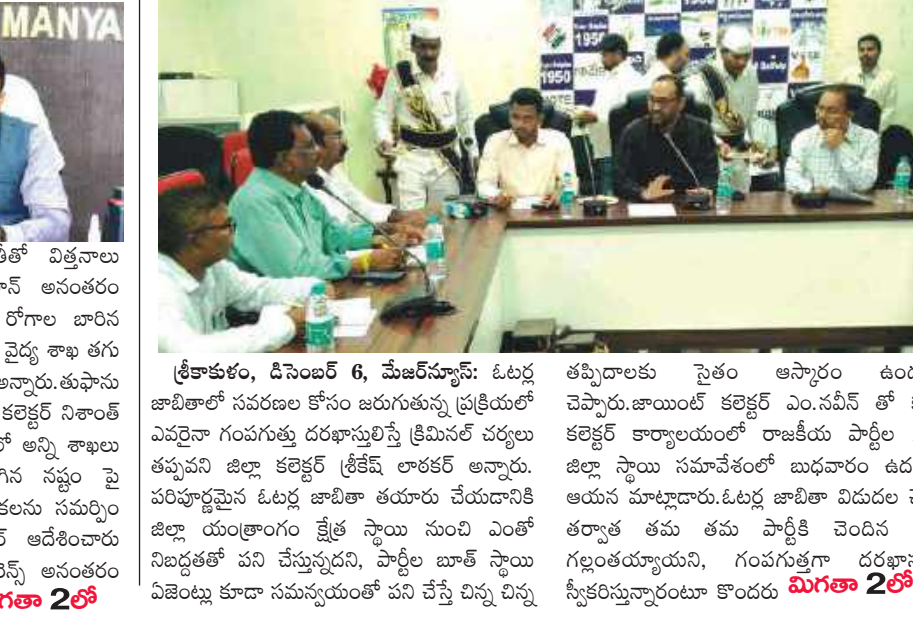
క్రీకాకళం, డిసెంబర్ 6, మేజర్స్ న్యూస్: ఓటర్ల జాబితాలో సవరణల కోసం జరుగుతున్న ప్రక్రియలో ఎవరైనా గంపగుత్తు దరఖాస్తులిస్తే క్రిమినల్ చర్యలు తప్పవని జిల్లా కలెక్టర్ శ్రీకేష్ లాకర్ అన్నారు. పరిపూర్ణమైన ఓటర్ల జాబితా తయారు చేయడానికి జిల్లా యంత్రాంగం క్షేత్ర స్థాయి నుంచి ఎంతో గుర్తింపుతో పని చేస్తున్నారని, పార్టీల బాకీ స్థాయి ఏజెంట్లు కూడా సమన్వయంతో పని చేస్తే చిన్న చిన్న తప్పిదాలకు సైతం అస్సారం ఉండదని చెప్పారు. జాయింట్ కలెక్టర్ ఎం.ఎస్.వీ. తో కలిసి కలెక్టర్ కార్యాలయంలో రాజకీయ పార్టీల 21వ జిల్లా స్థాయి సమావేశంలో బుధవారం ఉదయం ఆయన మాట్లాడారు. ఓటర్ల జాబితా విడుదల చేసిన తర్వాత తమ తమ పార్టీకి చెందిన ఓట్లు గుర్తించుకోవాలని, గంపగుత్తు దరఖాస్తులు స్వీకరిస్తున్నారంటూ మిగతా 2లో