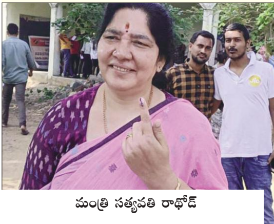
మంత్రి సత్యవతి రాథోడ్