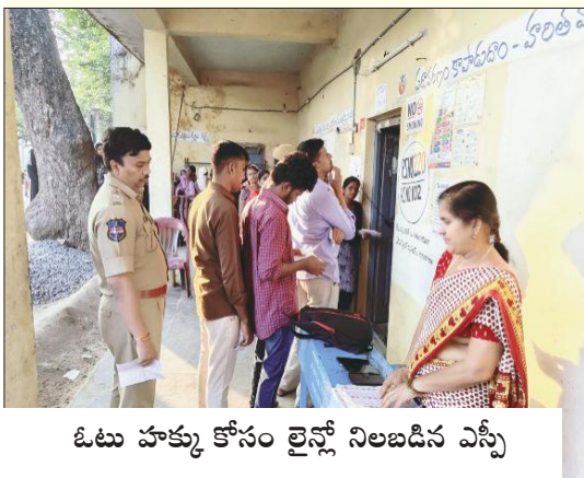
ఓటు హక్కు కోసం లైన్లో నిలబడిన ఎస్సీ