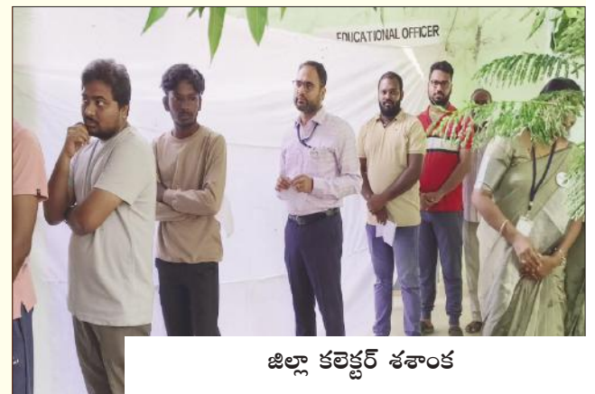
జిల్లా కలెక్టర్ శశాంక