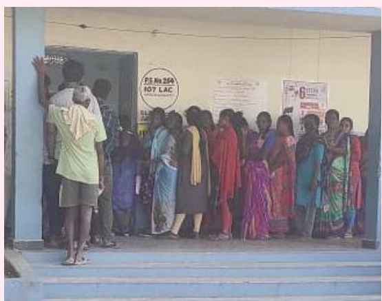
పర్వతగిరి,ప్రతినిధి నవంబర్30(మేజర్ న్యూస్ సూర్య)బీ- పర్వతగిరి మండలంలోని 19 (పాత జిపీలు) గ్రామాల్లోని 45 పోలింగ్ కేంద్రాల్లో 37వేల 537 ఓట్లు ఉండగా... గురువారం జరిగిన ఎలక్షన్ లో 33 వేల 708 ఓట్లు పోయాయి. 89.79 శాతం పోలింగ్ నమోదైనట్లు ఎన్నికల అధికారులు తెలిపారు.