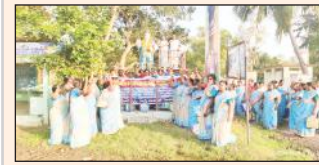
మొయిన సెంటర్ నందుగల అంబేద్కర్ విగ్రహం నందు చేరి, అంబేద్కర్ విగ్రహానికి వినతి ప్రార్థనా సమర్పించారు. వారి డిమాండ్లు నెరవేరే వరకు ఈ సమ్మెను కొనసాగిస్తామని ప్రభుత్వాని హెచ్చరించారు.

మండపల్లి మేజర్ స్టూన్స్: ఏలూరు జిల్లా కైకలూరు నియోజకవర్గం మండపల్లి మండలంలో వైయస్ జగన్మోహన్ రెడ్డి ప్రభుత్వం అంగన్వాడీ వర్కర్స్ కి చేస్తున్న అన్యాయంపై ఆంధ్రప్రదేశ్ రాష్ట్ర అంగన్వాడీ వర్కర్స్ అండ్ హెల్పర్స్ యూనియన్ సిబ్బంది మండపల్లి ప్రాజెక్ట్ కమిటీ అధ్యక్షులతో "అంగన్వాడీ సమస్యల పరిష్కారానికై నాలుగవ రోజు నిరావధిక సమ్మె" కార్యక్రమంలో పాల్గొన్నారు. మండపల్లి తాసిల్దార్ కార్యాలయం నుండి ర్యాలీగా మండపల్లి మొయిన సెంటర్ నందుగల అంబేద్కర్ విగ్రహం నందు చేరి, అంబేద్కర్ విగ్రహానికి వినతి ప్రార్థనా సమర్పించారు. వారి డిమాండ్లు నెరవేరే వరకు ఈ సమ్మెను కొనసాగిస్తామని ప్రభుత్వాని హెచ్చరించారు.