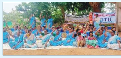
పనిచేయించడం దుర్భాగ్యమైన పనిగా అభివర్ణించారు. అదే విధంగా మిసీ అంగన్వాడీలను మొండి అంగన్వాడీలుగా రూపొందించడం చేశారు.

ఆగరిపల్లి, మేజర్ స్టూన్ : అంగనవాడీ వర్కర్స్ హెల్పర్స్ సమస్యలను పరిష్కరించడంలో ప్రభుత్వం మొండి వైఖరి విడనాడాలని అంగన్వాడీ కార్యకర్తలు పేర్కొన్నారు. సమైక్య భాగంగా ఆదివారం కూడా స్థానిక తహసీల్దార్ కార్యాలయం ఆవరణలో అంగన్వాడీ కార్యకర్తలు మాట్లాడుతూ గత ఆరు రోజుల నుండి అంగన్వాడీ సమస్యలు పరిష్కరించాలని కోరుతూ చేస్తున్న సమ్మె న్యాయపరమైనది అభిప్రాయం వ్యక్తం చేశారు. తమ డిమాండ్ కోసం సమ్మె చేస్తున్నప్పటికీ ప్రభుత్వం అంగన్వాడీ కేంద్రాల తాళాలు పగలు కొట్టి వార్డు సచివాలయాల నిబంధనలతో అంగన్వాడీలను పనిచేయించడం దుర్భాగ్యమైన పనిగా అభివర్ణించారు. అదే విధంగా మిసీ అంగన్వాడీలను మొండి అంగన్వాడీలుగా రూపొందించడం చేశారు.