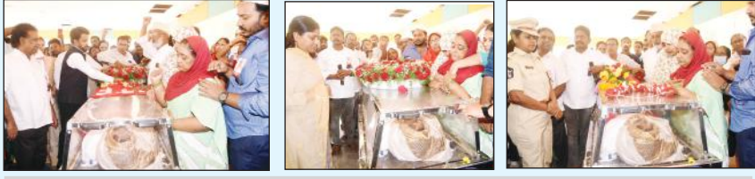
కన్నీరు మున్నీరయిన ఉద్యోగ, ఉపాధ్యాయ, కార్మిక సంఘాలు

విలూరు, మేజర్ స్టూన్స్: అకాల మరణం చెందిన శాసనమండలి సభ్యులు షేక్ సాబ్జి అంత్యక్రియలు విలూరులో ఆదివారం ఉద్యోగ, ఉపాధ్యాయ, కార్మిక, ప్రజా ప్రతినిధుల, అధికారుల కన్నీటి వీడ్కోలు మధ్యరాష్ట్ర ప్రభుత్వ లాంచనాలతో ముగిశాయి. రాష్ట్రంలోని అనేక ప్రాంతాల నుండి సిపిఎం నాయకులు, ఎమ్మెల్సీలు, కార్మికకర్షణ సంఘాల నాయకులు, యుద్ధింప నేతలు సాబ్జి భౌతిక కాయాన్ని