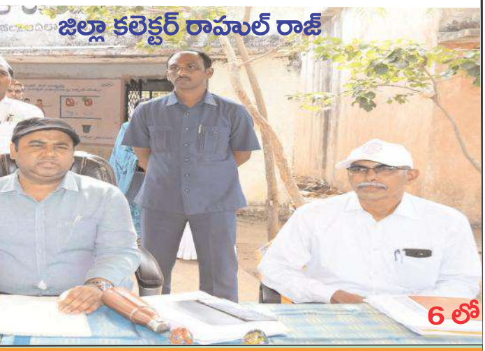
జిల్లా కలెక్టర్ రాహుల్ రాజ్