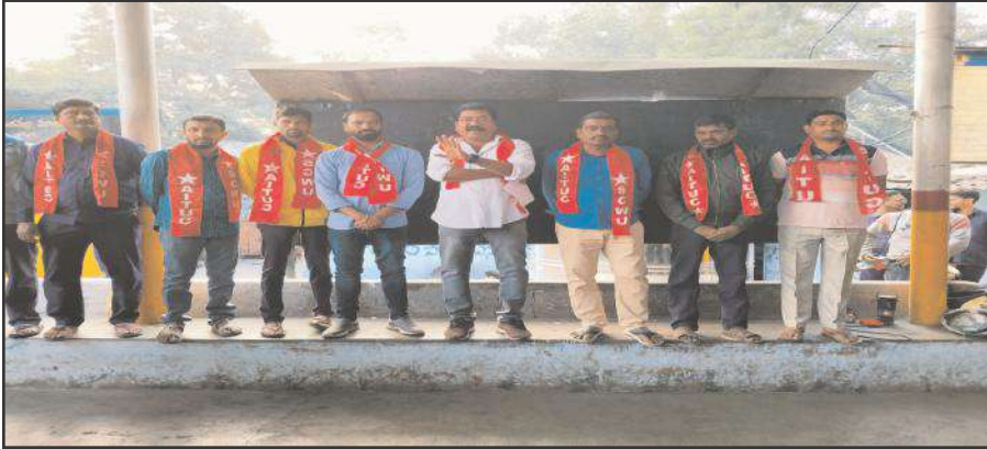
మందమరి టౌన్, జనవరి 12, సూర్య మేజర్ న్యూస్.