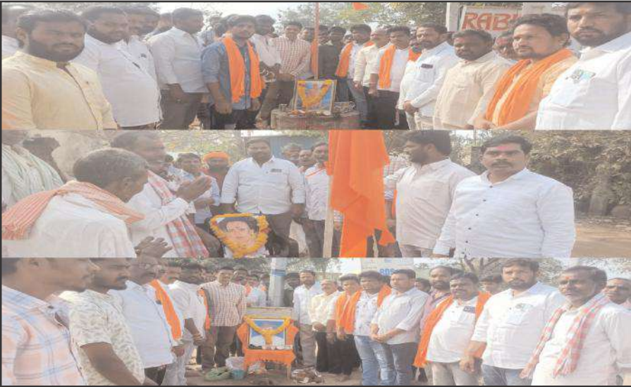
ముధోల్, జనవరి 12, సూర్య మేజర్ న్యూస్

-భగత్ సింగ్, అన్న భావు సారే విగ్రహ ఏర్పాటుకు భూమి పూజ