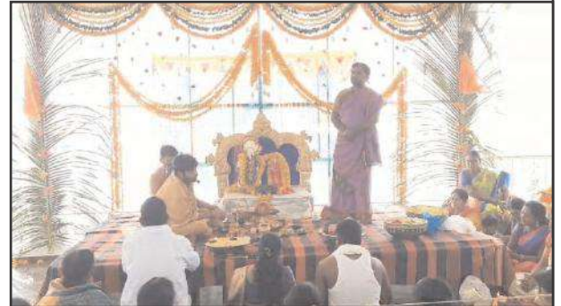
విచ్చేయడంతో ఆలయ ప్రాంగణమంతా భక్తులతో కిక్కిరిసిపోయింది. శ్రీ గోదాదేవి రంగనాథ స్వామి కళ్యాణాన్ని పురస్కరించుకొని రెండు

తలమడుగు మండలంలోని బరంపూర్ కొండపై వెలసిన శ్రీ లక్ష్మీ వెంకటేశ్వర స్వామి ఆలయంలో ప్రతి ఏడాది ఈ మాసంలో నిర్వహించే శ్రీ లక్ష్మీ గోదాదేవి రంగనాథ స్వామి కళ్యాణ మహోత్సవాన్ని వేద పండితుల మంత్రోచారాల నడుమ అంగరంగ వైభవంగా కళ్యాణ వేడుకలను జరిపారు. సంక్రాంతి పండగ సెలవులు కావడంతో ఆలయానికి ఈ కళ్యాణ మహోత్సవాన్ని తిలకించడానికి మండల వాసులే కాకుండా జిల్లా వ్యాప్తంగా భక్తులు