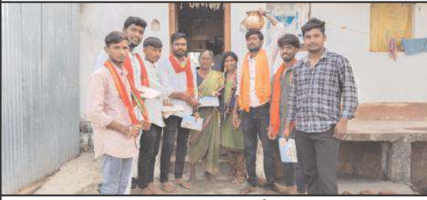
ఔంసా,జనవరి 14,సూర్య మేజర్ న్యూస్

ఔంసా మండలంలోని దేగాం గ్రామంలో అయోధ్య రాములోరి పూజిత అక్షింతలను ఇంటింటికి వితరణ గావించారు.కార్యక్రమంలో భాగంగా గ్రామస్తులు మరియు రామ భక్తులు ఇంటింటికి వెళ్లి అయోధ్య రాములోరి అక్షింతలను మహిళలకు ఇచ్చి వాటి ప్రాముఖ్యత గురించి వివరించారు. అంతేకాకుండా ఈనెల 22వ తేదీన అయోధ్యలో శ్రీరాముని విగ్రహ ప్రతిష్ఠాపన సందర్భంగా ఆరోజు అక్షింతలతో శ్రీరాముని చిత్రపటానికి పూజలు నిర్వహించాలని తెలిపారు. ఈ కార్యక్రమంలో గ్రామ ప్రజాప్రతినిధులు గ్రామ పెద్దలు, యువకులు,మహిళలు తదితరులు పాల్గొన్నారు.