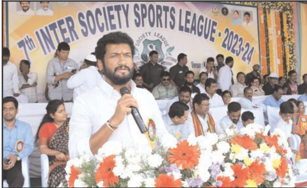
ఆదిలాబాద్ జనవరి 17 సూర్య మేజర్ న్యూస్