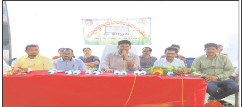
వేమనపల్లి, జనవరి 20, సూర్య మేజర్ న్యూస్