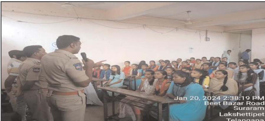
Jan 20, 2024 2:38:19 PM Beet Bazar Road Suraram Lakshettipet Telangana