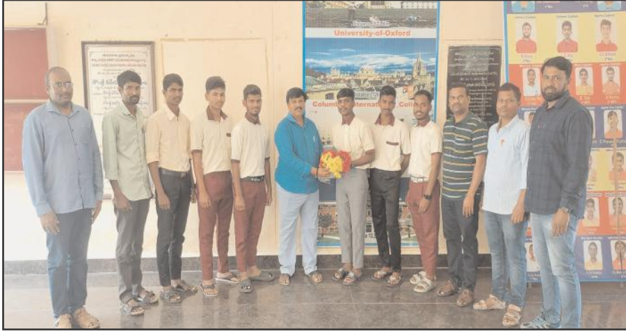
బెల్లంపల్లి,జనవరి20,సూర్య మేజర్ న్యూస్