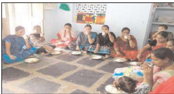
మూతపడిన ప్రభుత్వ పాఠశాలలో, కొనసాగిస్తున్నారు. 9

బోథ్ ఐసీడీఎస్ ప్రాజెక్టు పరిధిలోని నేరడిగొండ,మండలంలో గల గ్రామాల్లో మొత్తం 51 అంగన్వాడీ కేంద్రాలు ఉన్నాయి. వాటిలో 2634 మంది చిన్నారులు, గర్భిణులు, 350 మంది, బాలింతలు 300 మంది నిత్యం పౌష్టికాహారం పొందుతున్నారు. మొత్తం 51 అంగన్వాడీ కేంద్రాలకు గాను కేవలం 16 కేంద్రాలకు మాత్రమే సొంత భవనాలు ఉన్నాయి. మిగిలిన 26 అంగన్వాడీ కేంద్రాలను