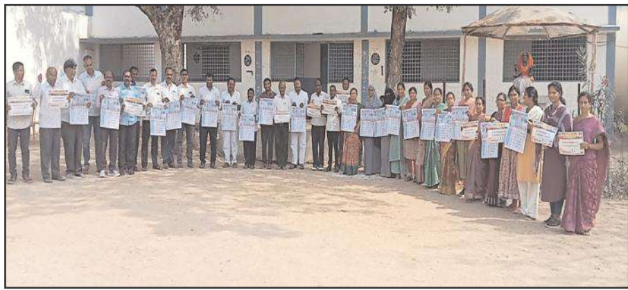
ముధోల్, జనవరి23,సూర్య మేజర్ న్యూస్