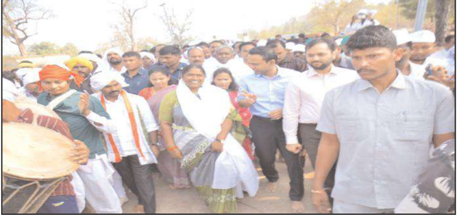
ఆసిఫాబాద్ ప్రతినది 23 జనవరి సూర్య మేజర్ న్యూస్