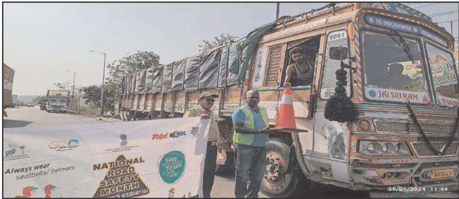
నేరడిగొండ జనవరి 25 సూర్య మేజర్ న్యూస్