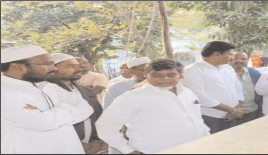
రామకృష్ణపూర్, జనవరి 25, సూర్య మేజర్ న్యూస్