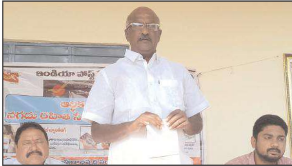
- వచ్చే ఐదు సంవత్సరాలు కూడా 100 మందికి బీమా పాలసీ కట్టిస్తానని హామీ ఇచ్చారు

తలమడుగు,జనవరి25,సూర్య మేజర్ న్యూస్ బీమా పాలసీ ప్రతి ఒక్కరూ చేయించుకోవాలని మండల జడ్పీటిసి గోక గణేష్ రెడ్డి అన్నారు. తలమడుగు మండలంలోని రుయ్యడి గ్రామంలో తలమడుగు జడ్పీటిసి గోక గణేష్ రెడ్డి తన సొంత డబ్బులతో వడ్డెర,బుడగ జంగం సామాజిక వర్గాలకు చెందిన 100