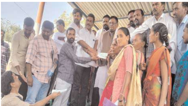
కార్యకర్తలు తదితరులు పాల్గొన్నారు.

కళ్యాణలక్ష్మి షాదీ ముబారక్ చెక్కుల పంపిణీ బెల్లంపల్లి ఎమ్మెల్యే గడ్డం వినోద్ మరియు కన్నెపల్లి మండల ఎంపిపి మాధవరపు సృజననర్సింగరావు ఆధ్వర్యంలో బెల్లంపల్లి %హా%2 ఏఎస్. గ్రౌండ్ లో కన్నెపల్లి మరియు భీమిని మండలాల లబ్ధిదారులకు చెక్కుల పంపిణీ చేయడం జరిగింది. ఎమ్మెల్యే గడ్డం వినోద్ మాట్లాడుతూ కాంగ్రెస్ ప్రభుత్వం. పేదల ప్రభుత్వమని ప్రతి కార్యక్రమం పేదల కోసమే అని వర్గాలకు 6 గాలంటీర్లు తప్పక అందిస్తామని వారు అన్నారు ఈ కార్యక్రమంలో కన్నెపల్లి మరియు భీమిని మండలాలకు చెందిన లబ్ధిదారులు సంబంధిత రెవెన్యూ అధికారులు మండల కాంగ్రెస్ పార్టీ ప్రతినిధులు నాయకులు