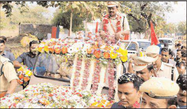
ఆదిలాబాద్,జనవరి05,సూర్య మేజర్ న్యూస్ :