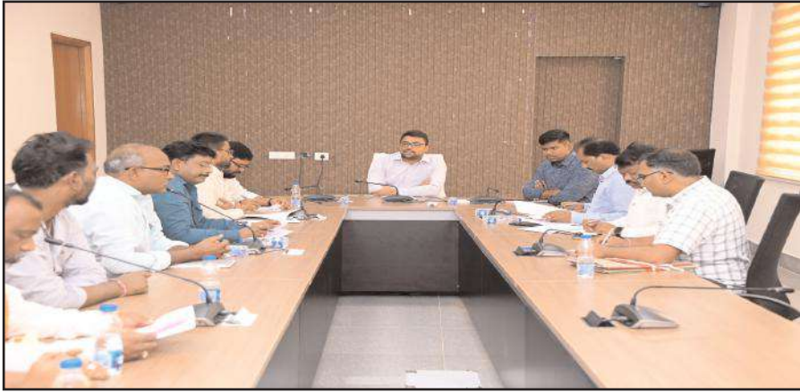
మంచీర్యాల ప్రతినిధి,జనవరి 05,సూర్య మేజర్ న్యూస్ :