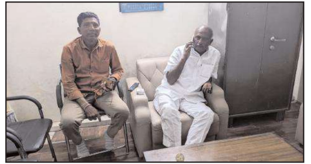
జడ్పీసీ డిపో మేనేజర్ తో మాట్లాడుతున్న ధ్యత్యం

తలమడుగు,జనవరి05,సూర్య మేజర్ న్యూస్ కాంగ్రెస్ ప్రభుత్వం వచ్చాక ఆరు గ్యారంటీల్లో ఒకటైన మహాలక్ష్మి పథకంలో భాగంగా మహిళలకు ఉచితంగా బస్సు సౌకర్యం కల్పించడంతో మహిళలు హర్షం వ్యక్తం చేస్తున్న తలమడుగు మండల మండలానికి సరైన బస్సు సౌకర్యం లేకపోవడంతో మహిళలు ప్రయాణికులు అసంతృప్తిగా ఉన్నారని జడ్పీసీ గోక గణేష్ రెడ్డికి తెలియగానే వెంటనే స్పందించి ఆదిలాబాద్ డిపో హౌసింగ్ మేనేజర్తో చరవాణిలో మాట్లాడి బస్సు ట్రిప్పలను పెంచాలని విజ్ఞప్తి చెయ్యాలని గురువారం కోరడంతో శుక్రవారం నుంచి తలమడుగు మండలానికి బస్సు ట్రిప్పలు పెంచడంతో తలమడుగు మండల వాసులు మహిళలు ప్రయాణికులు జడ్పీసీ గోక గణేష్ రెడ్డికి ధన్యవాదాలు తెలియజేశారు.