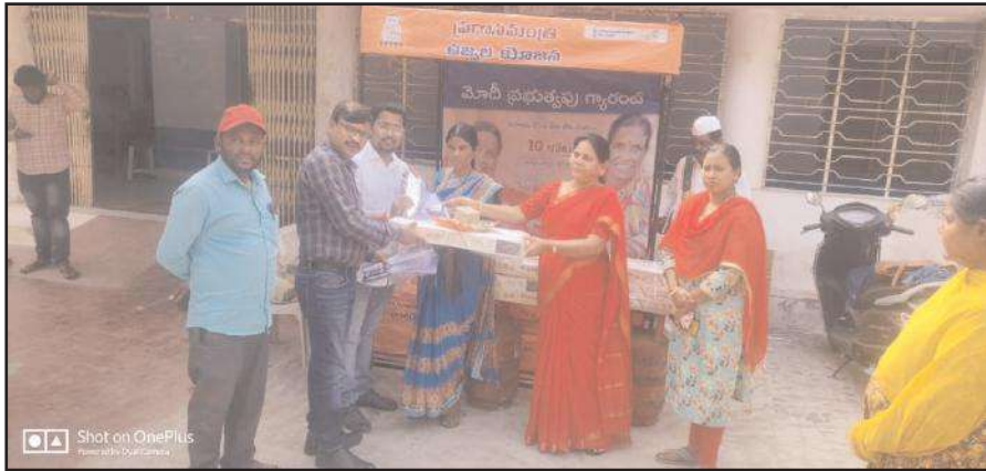
ఆదిలాబాద్ జనవరి 05 సూర్య మేజర్ న్యూస్