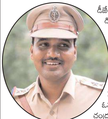
మందమరి టౌన్, 5 జనవరి, సూర్య మేజర్ న్యూస్.