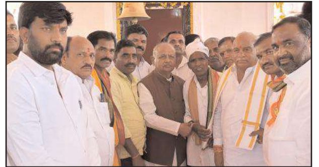
కుంటాల,జనవరి 05,సూర్య మేజర్ న్యూస్