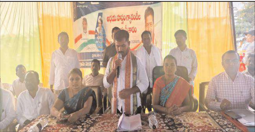
ఇంద్రవెల్లి,జనవరి05,సూర్య మేజర్ న్యూస్: