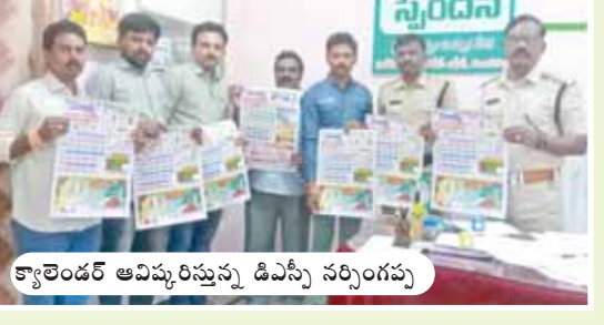
కౄతిండ్లర్ ఆవిష్కరిస్తున్న డిఎస్సీ సర్సింగప్ప