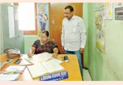
క్వారీపై దాడులు చేస్తున్న విజిలెన్స్ అధికారులు (ఫైల్ ఫోటో), కదిరిలో పముఖ పైవేటు పాఠశాలలో రికార్డులు తనిఖీ చేస్తున్న డిఈఓ (ఫైల్ ఫోటో)