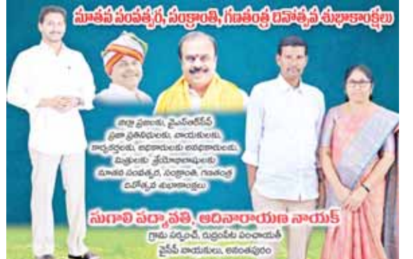
మాతవేదిక, సంక్రాంతి, గణపతి దేవాలయ శుభాకాంక్షలు