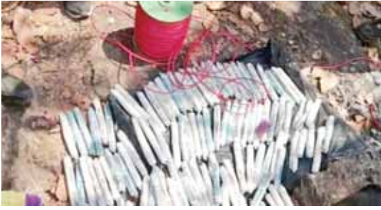
ఎలాంటి చర్యలకు కూడా దిగకపోవడం గమనారంగా మారింది. ఈ అంశానికి సంబంధించి మరిన్ని కథనాలతో మీ ముందుకు వస్తాం.

సహకారాలు అందిస్తుండడంతో ఈ వ్యవహారం ఏళ్ల తరబడిగా యధేచ్ఛగా సాగిపోతుందని అంటున్నారు. ఆయా శాఖలకు సంబంధించి ప్రతినెల మామూలు ముట్ట చెప్పడంతో ఎవరికి వారు కళ్ళు మూసుకొని అందిన కాడికి దోచుకుని చూసి చూడనట్టుగా వ్యవహరిస్తున్నారని బలమైన ఆరోపణలు వినిపిస్తున్నాయి. వీటికి సంబంధించి ఎలాంటి దాడులు ఎలాంటి వ్యవహారాలు కొనసాగించకపోవడంతో ఈ వ్యవహారాన్ని అత్యంత చాకచక్యంగా జిల్లా కేంద్రంలోని యదేచ్ఛగా కొనసాగిస్తున్నారు. ఎవరికి వారికి వారి వారి వారు అందిస్తున్న నేపథ్యంలో ఎలాంటి అడ్డంకులు లేకుండా పూర్తి సన్నద్ధతతో జిల్లా కేంద్రంలో ఈ వ్యవహారాన్ని చక్కబెడుతున్నారు. ఓ పార్టీ నాయకుడు కీలకంగా వ్యవహరిస్తున్న నేపథ్యంలో అతనిపై