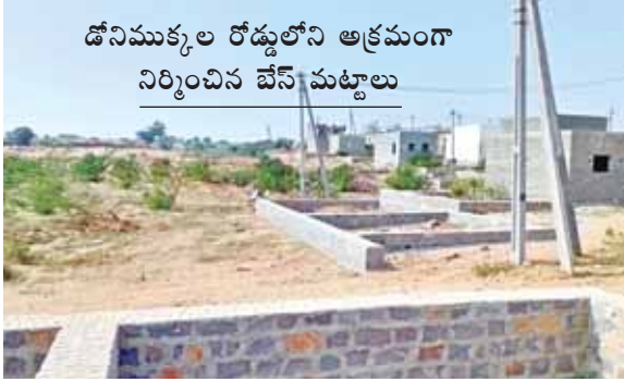
డోనిముక్కల రోడ్డులోని అక్రమంగా నిర్మించిన బేస్ మట్టాలు

కంటి తుడుపు చర్యలూ మధ్యతరగతి, పేదలను దోచుకుంటున్నట్లు పక్క ఆధారాలతో నిబంధనలు విరుద్ధంగా పలు ప్రైవేట్ కార్పొరేట్ ఆసుపత్రులు బయటపడుతున్న జనం నుండి ఫిర్యాదులు వస్తున్న అధికారులు దాడులు నిర్వహించి అటువంటి వాటిని సీజ్ చేస్తామని చెప్పినప్పటికీ అది కంటితుడుపు చర్యగానే మిగిలిపోతూ ఉంది. తాజాగా ఒక ప్రైవేటు నర్సింగ్ హోమ్ నందు వైద్యం వికలించి వ్యక్తి మృతి చెందితే డాక్టర్ల శవాన్ని ముందర పెట్టుకొని బేరమాడిన ఘటనలు ఎన్నో జరిగాయి. మృతి చెందిన కుటుంబ సభ్యులకు ఎంతో కొంత డబ్బులు ముట్టజెప్పి డాక్టర్ల మీద కేసులు రాకుండా చేసుకుంటున్నారు. అనంతపురం జిల్లా మరియు మండల పరిధిలో వందల కొద్ది గుర్తింపలేని డయాగ్నోస్టిక్ సెంటర్లు ఫార్మాసిస్టులో అనుభవం లేని సిబ్బందిని పెట్టుకొని ప్రైవేటు ఆసుపత్రి నడుపుతున్నారు. ఇప్పటికైనా దర్యాప్తు సంస్థల నిఘాధికారులు, వైద్య శాఖ ఉన్నతాధికారులు నిబంధన విరుద్ధంగా నడుచుకుంటూ ధనార్జన ధ్యేయంగా ముందుకు పోతున్న ప్రైవేట్, కార్పొరేట్ ఆసుపత్రులపై కఠిన చర్యలు తీసుకోవాలని పలువురు ప్రజానీకం కోరుతున్నారు.