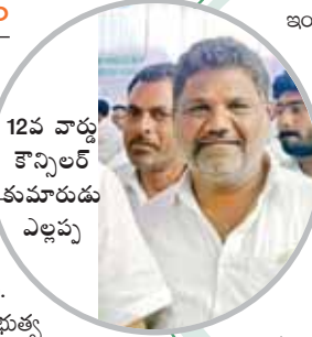
12వ వార్డు కౌన్సిలర్ కుమారుడు ఎల్లప్ప

గుంతకల్లు పట్టణంలోనే ధోని ముక్కల రోడ్డులో ప్రభుత్వం ఎంతోమంది నిరుపేదలకు ఇళ్లపట్టాలను మంజూరు చేసి ఇళ్లను నిర్మిస్తుంది. దాంతో పాటుగా కాలనీల ను ఎంతో అభివృద్ధి చేస్తుంది. దాంతో అక్కడ ప్రస్తుతం ప్రైవేట్ ప్రభుత్వ స్థలాలకు భారీగా విలువలు పెరిగిపోయాయి.