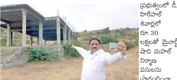
ప్రభుత్వంలో డి. హిరేహల్ శివార్లల్ రూ. 30 లక్షలతో మైనార్టీ షాది మహల్ నిర్మాణ పనులను ప్రారంభించా

నాయకులు బాబు ఘారిణీ- భవిష్యత్తుకు గ్యారెంటీ పేరుతో ప్రజల్లోకి వెళ్తుండగా... జనసేన నాయకులు కూడా యువతను పార్టీలోను ఆహ్వానిస్తూ పార్టీ బలంపై దృష్టి పెడుతూ ప్రజా సమన్వయం పోరాటాలు చేస్తూ ముందుకు సాగుతున్నారు. అయితే సాధారణ ఎన్నికలకు గడువు సమీపిస్తున్నా పార్టీల అధినేతల ఆదేశాలను అమలులోకి తీసుకుంటూ టీడిపి, జనసేన నాయకులు సమన్వయంతో పనిచేయలేకపోతే ఇక ఎన్నికలప్పుడు ఇరు పార్టీల మధ్య ఎలాంటి సమన్వయం ఉత్పన్నమవుతాయోననే చర్చ జరుగుతోంది. ఇరు పార్టీల నియోజకవర్గాల ఇన్చార్జీలు ముందు నాయకులు, కార్యకర్తల మధ్య సవ్యాధ్యావ వాతావరణం, సమన్వయంతో ప్రజల్లోకి వెళ్లి పనిచేస్తే వచ్చే ఎన్నికల్లో మంచి ఆశాజన్మక ఫలితాలు వచ్చే అవకాశం ఉంది. మరి ఇరు పార్టీలు నాయకులు మన్మండు సమన్వయంతో పనిచేస్తారా లేక ఎమ్మెల్యే టికెట్లు కేటాయించిన తరువాత ఏ పార్టీకి ఎక్కడ టికెట్ ఇస్తారో అప్పుడు చూద్దామలే అని వేచిచూస్తున్నట్లు సమాచారం.