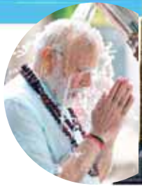
అట్టహాసంగా ప్రధాని మోడీ చేతుల మీదుగా అయోధ్య రామయ్య బాల రాముడు విగ్రహం ప్రతిష్ఠ

న అనంతపురం బ్యూటీ మేజర్ న్యూస్ - విన్నవారికి విన్నంత.. చూసిన వారికి తరించినంత జన్మజన్మల పుణ్యఫలం ఆ అయోధ్య మందిర దర్శనం. జైశ్రీరామ్... వివాదం నుండి ప్రారంభం వరకు. ఎందరో అపూర్వ భక్తజనుల ఆ్యాగఫలంతో ఆ మహా పురుషుడు