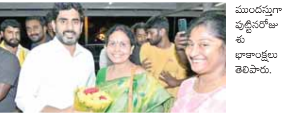
ముందుస్తుగా పుట్టినరోజు శుభాకాంక్షలు తెలిపారు.