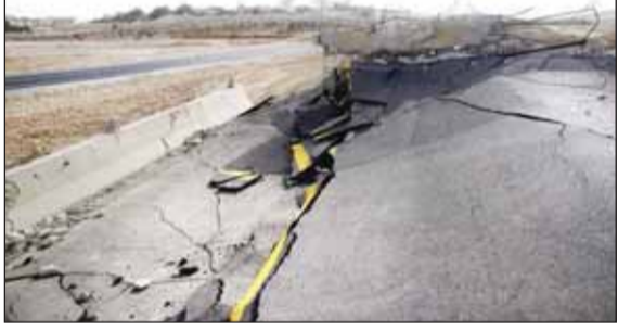
ప్రపంచవ్యాప్తంగా సంవత్సరానికి 6200 వరకు వస్తుంటాయని నిపుణులు పేర్కొన్నారు. వీటిలో తక్కువ నష్టం చాలిట్లుంటుందన్నారు.

రెండు రాష్ట్రాలను భూకంపాలు వణికించాయి. హిమాచల్ ప్రదేశ్, జమ్మూ కశ్మీర్ లో శనివారం మధ్యాహ్నం భూకంపాలు సంభవించాయి. శనివారం మధ్యాహ్నం 1.16 గంటల సమయంలో హిమాచల్ ప్రదేశ్ లో చండారో రిక్టర్ స్కేల్పై 3.1 తీవ్రతతో ప్రకంపనలు వచ్చాయి. భూమికి తొమ్మిది కిలోమీటర్ల లోతులో భూకంప కేంద్రాన్ని గుర్తించినట్లు నేషనల్ సెంటర్ ఫర్ సెస్టోలజీ తెలిపింది. అయితే, భూకంపం కారణంగా ఏదాంటి నష్టం జరుగలేదని అధికార వర్గాలు తెలిపాయి. మధ్యాహ్నం సమయంలో ఒక్కసారిగా ప్రకంపనలు రావడంతో జనం ఇంట్ల నుంచి బయటకు వచ్చుతుంటే పెట్టారు. అలాగే, మధ్యాహ్నం 1.55 గంటల సమయంలో జమ్మూ కశ్మీర్ లోని కిష్టాబద్లోనూ ప్రకంపనలు వచ్చాయి. రిక్టర్ స్కేల్పై 3.1 తీవ్రతతో ప్రకంపనలు రాగా.. భూమికి 20 కిలోమీటర్ల లోతులో భూకంప కేంద్రం గుర్తించినట్లు ఎన్.సి.ఎస్ తెలిపింది. ఇదిలా ఉండగా..