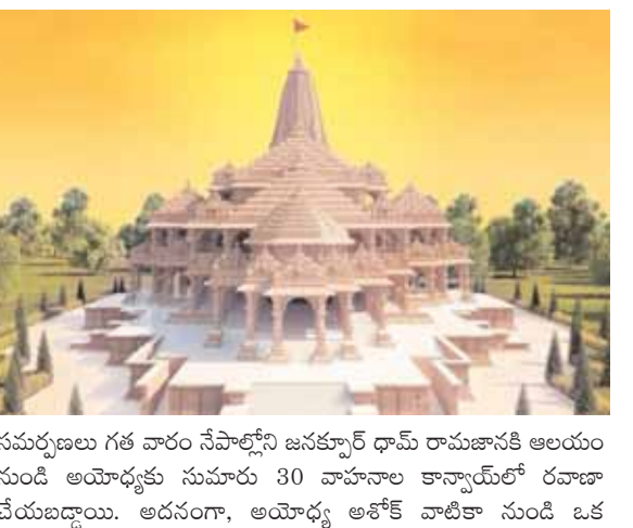
సముద్రం గత వారం నేపాల్లోని జనకపూర్ ఠామే రామజానకి ఆలయం నుండి అయోధ్యకు సుమారు 30 వాహనాల కాన్వాయిలో రవాణా చేయబడ్డాయి. అదనంగా, అయోధ్య అశోక్ వాలీకా నుండి ఒక