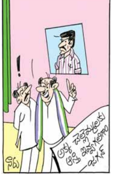
ఈ గొడవంతా ఆస్తికోసమే కదా