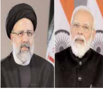
డిల్లీ: బలూచిస్లాన్లోని మిలిటెంట్ స్థావరాలపై డ్రాన్స్, క్షిప్రణులతో ఇరాన్ విరుచుకుపడడంపై భారత్ సుస్పృహగా స్పందించింది. ఇది పూర్తిగా ఇరాన్, పాక్ అంతర్గత వ్యవహారమని వ్యాఖ్యానిస్తూ... ఆత్మరక్షణలో భాగంగా కొన్ని దేశాలు తీసుకునే