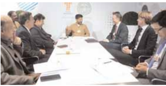
తెలంగాణ బ్యూరో, ప్రతినిధి: ప్రజలందరికీ డిజిటల్ హెల్త్ కార్డులు అందజేస్తామని ముఖ్యమంత్రి రేవంత్ ప్రకటించారు. ప్రజలందరికీ ఉత్తమ వైద్యసేవలు అందించాలనేదే నా లక్ష్యమన్న ఆయన, డిజిటల్ ఆరోగ్య కార్డుల దేలా భద్రత, ప్రైవేసీని కాపాడుతామని హామీ ఇచ్చారు. దావాస్తో జరుగుతున్న ప్రపంచ ఆర్థిక వేడిక నడస్సులో హెల్త్ కేర్ డిజిటలైజేషన్ అంశంపై రేవంత్ ప్రకటించారు. నాణ్యమైన వైద్యసేవలు పొందడం ఖర్చుతో కూడుకున్న విషయమన్న ఆయన, రాజీవ్ ఆరోగ్యశ్రీ పథకం కింద పేదలకు రూ.10 లక్షల వరకూ ఉచిత వైద్యం అందిస్తున్నట్లు తెలిపారు. అత్యుత్తమ వైద్యసేవలకు, సాఫ్ట్వేర్ సేవలకు హైదరాబాద్ రాజధాని అన్న రేవంత్ రెడ్డి... ప్రపంచ వ్యాప్తంగా, ఔషధాల్లో

● దావాస్తో వెల్లడించిన సీఎం రేవంత్ రెడ్డి ● ప్రజలందరికీ ఉత్తమ వైద్యసేవలు అందించాలనేదే నా లక్ష్యం 33 శాతం హైదరాబాద్లో ఉత్పత్తి అవుతున్నాయని స్పష్టం చేశారు. ప్రభుత్వ ప్రైవేటు భాగస్వామ్యంలో అత్యుత్తమ సాంకేతికత సాయంతో నాణ్యమైన వైద్యసేవలు అందిస్తామని, ప్రజలందరికీ డిజిటల్ హెల్త్ కార్డులు పంపిణీ చేస్తామన్నారు. 7 వేల కోట్ల పారిశ్రామిక ఒప్పందాలు మరోవైపు దాదాపు 37 వేల కోట్ల పారిశ్రామిక ఒప్పందాలు జరిగాయి. 12,400 కోట్ల రూపాయల పెట్టుబడి పెట్టేందుకు అదానీ గ్రూప్ ముందుకొచ్చింది. అదానీ ఎయిరోస్పేస్ పార్కులో కౌంటర్ డ్రోన్, క్లిప్బయిల పరిశోధన, అభివృద్ధి, డిజైన్, ఉత్పత్తిపై పడేశ్తో వెయ్యి కోట్ల రూపాయలు పెట్టుబడి పెట్టనుంది. ఇంటిగ్రేటెడ్ స్మిల్ యూనివర్సిటీ ఏర్పాటు చేయాలన్న సీఎం రేవంత్ ప్రకటించిన కార్యక్రమం అదానీ అంగీకరించారు. అంబజా సిమెంట్స్ పరిశ్రమను నెలకొల్పేందుకు రాష్ట్ర ప్రభుత్వం అనుమతి చేసుకుంది. 1400 కోట్ల రూపాయలతో దాదాపు 70 ఎకరాల్లో ఏటా 60 లక్షల టన్నుల ఉత్పత్తి సామర్థ్యంతో ఫ్లాంట్ ను నెలకొల్పనుంది. అదానీ ఎంటర్ ప్రైజెస్ చందనవెల్డెర్ 5 వేల కోట్ల రూపాయలతో 100 మోనోక్లౌడ్ డేటా సెంటర్లు నెలకొల్పనుంది. అదానీ సంస్థలో తెలంగాణ ప్రభుత్వం నాలుగు ప్రాజెక్టులకు ఒప్పందాలు చేసుకుంది.