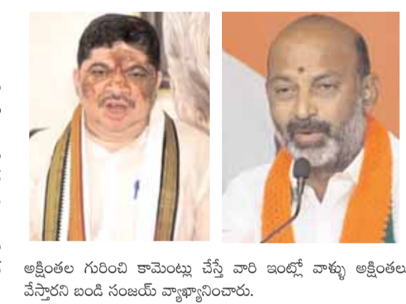
అక్షింతల గురించి కామెంట్లు చేసే వారి ఇంట్లో పాళ్లు అక్షింతలు వేస్తారని బండి సంజయ్ వ్యాఖ్యానించారు.

గజ్జెలు అంటే ఎలా?.. ఎవరి నలహారీ.. అవసరం లేకుండా.. నరులకు నాగరికత నేర్పిన వేసేతను ఆడుకుని తీరుతాం అని మంత్రి పాన్సం ప్రభాకర్ స్పష్టం చేశారు. బండి సంజయ్ కౌంటర్.. : అంతకుముందు మంత్రి పాన్సం ప్రభాకర్కు బీజేపీ జాతీయ ప్రధాన కార్యదర్శి బండి సంజయ్ కౌంటర్ ఇచ్చారు. అయోధ్య అక్షింతలను రేపే బియ్యం అనడం మంచి పద్ధతి కాదని, అక్షింతలు అంటే ఎమెర్జీ మీ కుటుంబ సభ్యులను అడ్డంగాని, వాటి ప్రాముఖ్యత గురించి తెలియకుండా మాట్లాడవద్దన్నారు. రామ మందిర ప్రాణ ప్రతిష్ఠని రాజకీయం చేయద్దన్నారు. అక్షింతలను రేపే బియ్యం అనే వారికి వాటి ప్రాముఖ్యత, పటిష్ఠత తెలియదన్నారు.