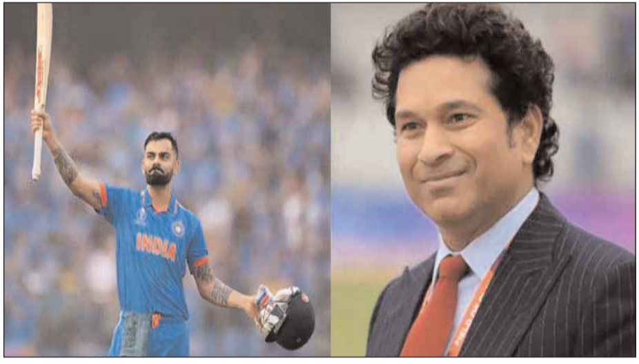
దూరంలో జో రూట్ ఉన్నాడు. తన కూడా ఇండియా అంటే చాలు, బ్రావ్హండంగా ఆడతాడు. ఇండియాపై తనకి మంచి ట్రాక్ రికార్డ్ ఉంది. కానీ సచిన్ రికార్డ్ ఏమిటంటే, తన రికార్డులను ఒక ఇండియన్ బ్రేక్ చేయాలి. అప్పుడే సంతోషమని తెలిపాడు. మరీ క్రీకెట్ గురువుగా పేర్కొనే సచిన్ మాటలను కోహ్లా నిలబెడతాడా? లేదా చూడాలి.

టెండూల్కర్ రికార్డును బ్రేక్ చేసే అవకాశం ఉంది. ఐదు టెస్టుల్లో మొత్తం 10 ఇన్నింగ్సు లో తన ఉన్న ఫాఫ్ కి అది సాధ్యమేనని అంటున్నారు. అలాగే సెంచురీల సంఖ్య కూడా పెంచుకోవాలని అభిమానులు కోరుతున్నారు. ఇప్పటికి టెస్టుల్లో 29, వన్డేలో 50, టీ 20లో 1 సెంచురీ మొత్తం 80 ఉన్నాయి. ఈ టెస్టు మ్యాచ్ లో సచిన్ ఎక్కువ సెంచురీలు చేయగలిగితే అంత మంచిదిని అంటున్నారు. ఇంగ్లండ్ కీలక ప్లేయర్ జో రూట్ ఇప్పటివరకు ఇండియాపై 9 సెంచురీలు చేశాడు. ఈ జాబితాలో సచిన్ టెండూల్కర్, రాహుల్ ద్రవిడ్, అలిష్టర్ కుక్లు ఏదీని సెంచురీలతో రెండో స్థానంలో ఉన్నారు. కోహ్లా 5 సెంచురీలు మాత్రమే చేశాడు. సచిన్ రికార్డ్ కి కేవలం 10 పరుగుల