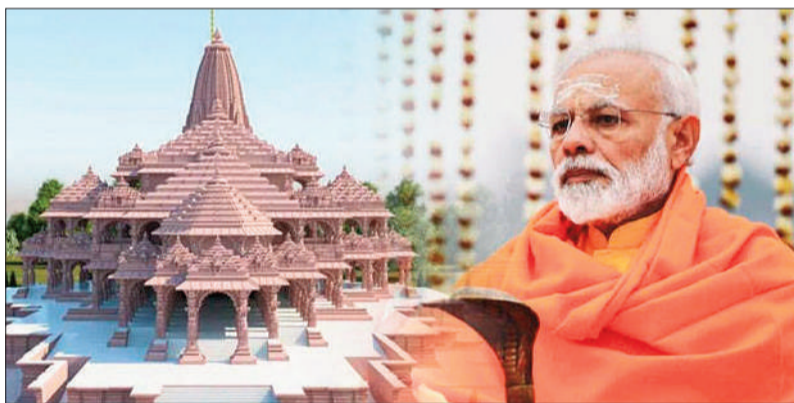
మొదలైంది. అప్పటి నుంచి ఎలా ముందుకు సాగింది. అసలు అప్పటి నుంచి ఎలా వివాదం సాగింది. దేశంలోని అన్ని రామ మందిరాలలో పోలిస్తే.. అయోధ్య రామాలయం చాలా ప్రత్యేకం. ఎందుకంటే రాముడి జన్మభూమిగా భావించే చోటు.. రామ మందిరాన్ని నిర్మించడం కోసం ఎన్నో పోరాటాలు జరిగాయి. మరెన్నో వివాదాలు అయోధ్యను చుట్టుముట్టాయి. మొఘలుల పరిపాలన కాలంలో 1528 లో అయోధ్యలో బాబ్లీ మసీదు నిర్మాణానికి.. అప్పటి చక్రవర్తి బాబర్ పాలనలో కమాండర్ గా ఉన్న మీర్

500 ఏళ్ల హిందువుల కల నెరవేరేందుకు కొన్ని గంటలు మాత్రమే ఉంది. ఈ అద్భుత ఘట్టం కోసం ప్రపంచ వ్యాప్తంగా ఉన్న కోట్లాదిమంది హిందువులు ఎదురుచూస్తున్నారు. అయోధ్యలో రామ మందిర నిర్మాణం కోసం వందల ఏళ్ల నుంచి ఎన్నో పోరాటాలు జరిగాయి. అయితే అయోధ్యలో బాబ్లీ మసీదు నిర్మాణం నుంచి కూర్చోవేత... ఆ తర్వాత రామ మందిర నిర్మాణం పూర్తయ్యేవరకు అసలు ఏం జరిగింది అనేది తెలుసుకుందాం. కోట్లాది మంది భారతీయుల కల ఆయన అయోధ్య రామ మందిర నిర్మాణం పూర్తి చేసుకుంది. త్వరలోనే అయోధ్యలో రామ్ లల్లా ప్రాణప్రతిష్ఠ జరగనుంది. ఈ నేపథ్యంలోనే అయోధ్య ఆలయాన్ని సర్కార్ సందరంగా ముస్లింలు చేశారు. అయితే 1528 లో ప్రారంభమైన అయోధ్య రామ మందిర వివాదం.. 2019 లో సుప్రీం కోర్టు తీర్పుతో ముగిసింది. ఈ క్రమంలోనే అసలు 1528 లో వివాదం ఎలా