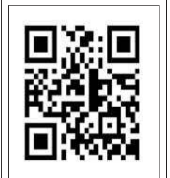
సూర్య వెబ్ సైట్