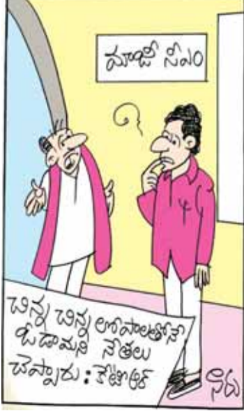
ఆ లోపాలే జనానికి కోపాలుగా మరాయేమో సారీ