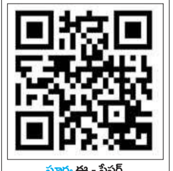
సూర్య ఈ - పేజర్