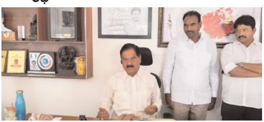
నిధులు మంజూరు చేయాలని వినతిపెట్టిన సర్పంచ్