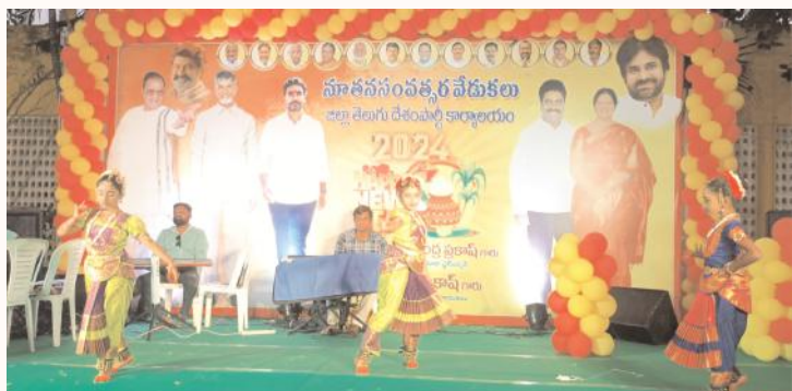
జిల్లా టీడిపి పార్టీ కార్యాలయంలో ముందస్తు నూతన సంవత్సర వేడుకలలో భాగంగా నిర్వహిస్తున్న సాంస్కృతి కార్యక్రమాలు