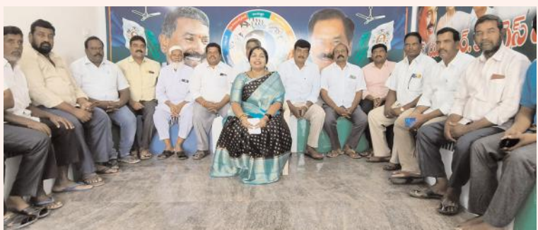
పెనుమూరు మేజర్ న్యూస్