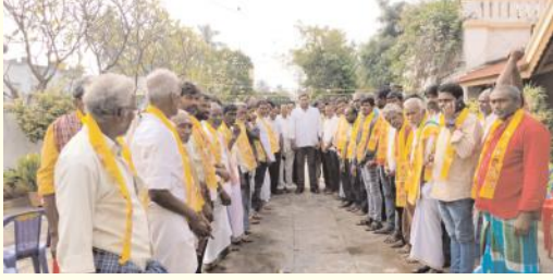
టిడిపిలో చేరుతున్న వేదం గ్రామస్థులు