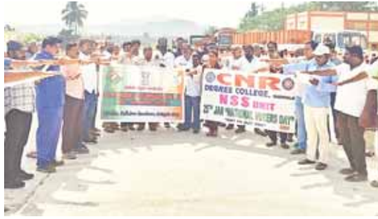
ర్యాలీ నిర్వహిస్తున్న అధికారులు