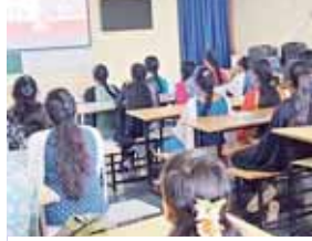
కార్యక్రమంలో పాల్గొన్న విద్యార్థినులు

కుప్పం, మేజర్ న్యూస్: జాతీయ ఓటర్ల దినోత్సవాన్ని పురస్కరించు కుప్పం డిగ్రీ కళాశాల విద్యార్థులు ర్యాలీ నిర్వహించారు. ఈ సందర్భంగా ప్లకార్డులు పట్టుకొని నినాదాలు చేస్తూ ఓటర్లను వైత