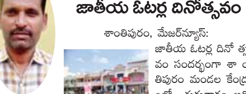
ఓటర్ల దినోత్సవం దృశ్యం