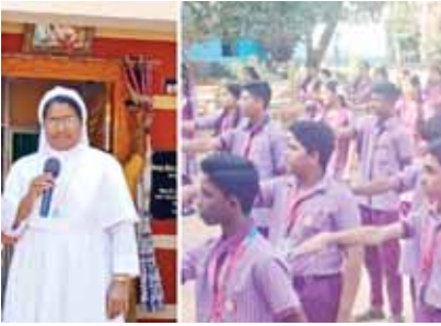
ఓటర్ల దినోత్సవం సందర్భంగా విద్యార్థులచే ప్రతిజ్ఞ

బంగారుపాళ్ళం, మేజర్స్ న్యూస్: స్థానిక సెయింట్ మేరీస్ ఇంగ్లీష్ మీడియం పాఠశాలలో గురువారం జాతీయ ఓటర్ల దినోత్సవం భాగంగా విద్యార్థుల చేత ప్రతిజ్ఞ చేయించారు. ఈ సందర్భంగా పాఠశాల ప్రధాన ఉపాధ్యాయురాలు ఎల్వీపీఎం మాట్లాడుతూ ఒక మనిషి విలువ గురించి తెలియజేసేదే ఓటు హక్కు అని అన్నారు. 18 సంవత్సరాలు నిండినవారు తప్పనిసరిగా ఓటు నమోదు చేసుకోవాలని కోరారు. ఈ కార్యక్రమంలో పాఠశాల ఉపాధ్యాయులు, విద్యార్థులు పాల్గొన్నారు.