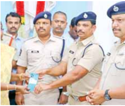
సెల్ఫోన్లను అందచేస్తున్న ఎస్పీ

దర్భాపు చేసి సెల్ ఫోన్ పోగొట్టుకున్న బాధితులకు అండగా నిలిచారన్నారు. జిల్లాలో ఇప్పటివరకు బాధితులు పోగొట్టుకున్న సెల్ ఫోన్లు 7 విడతలుగా రూ. 4,01,40,000/- ల విలువ గల 2,230 సెల్ ఫోన్లను రికవరీ చేసి పోగొట్టుకున్న బాధితులకు జిల్లా ఎస్పీ అందజేశారు. ఇందులో భాగంగా 8వ విడతలో ౧౪౪ నెల రోజుల వ్యవధిలోనే సుమారు రూ.72,00,000/- ల విలువ గల 400 మొబైల్ ఫోన్ల రికవరీ చేసి బాధితులకు అందజేశామని తెలిపారు. జిల్లా వ్యాప్తంగా 8 విడతలలో సుమారు రూ.4,73,40,000/- ల విలువ గల 2,630 సెల్ ఫోన్లను రికవరీ చేసి సెల్ ఫోన్లు రికవరీ చేశామన్నారు. రాష్ట్ర డిజిపి కె.వి.రాజేంద్రనాథ్ రెడ్డి ఆదేశాలతో జిల్లా ఎస్పీ పి.పరమేశ్వర రెడ్డి పర్యవేక్షణలో సైబర్ క్రైమ్ సి.ఐ. ఓ.రామచంద్ర రెడ్డి అధ్యక్షత్వంలో ప్రత్యేక బృందాన్ని ఏర్పాటు చేసి పోగొట్టుకున్న మొబైల్స్ను రికవరీ చేసి బాధితులకు అందజేస్తున్నామన్నారు. జిల్లా పోలీస్ ఛోరల్ సేవలు గురించి ప్రజలకు విస్తృతంగా అవగాహన కల్పిస్తున్నామని, దీనితోపాటు తమ వంతుగా మీడియా ప్రచారానికి సహకరించాలని కోరారు. ఈ యాప్ లను జిల్లా ప్రజలే కాకుండా నగరానికి వచ్చే యాత్రికులు కూడా మొబైల్ హాంట్, సిఐఆర్