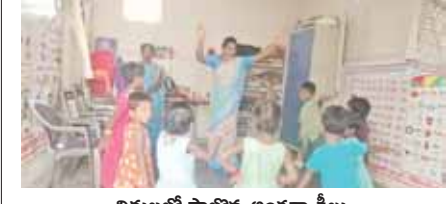
విధులలో పాల్గొన్న అంగన్వాడీలు

కార్యదర్శి నగరం, మేజర్ న్యూస్: కార్యదర్శి నగరం మండల కార్యాలయావరణలో 42వ రోజుగా కొనసాగిన నిరవధిక సమ్మెలో భాగంగా రాష్ట్ర ప్రభుత్వం అంగన్వాడీ ఉద్యోగుల డిమాండ్లు పరిష్కరిస్తామని హామీతో విరమించిన సమ్మె జీవో రూపంలో ఇవ్వనున్న రాష్ట్ర ప్రభుత్వం ఉత్సాహంగా మళ్ళీ తెరుచుకున్న అంగన్వాడీ పాఠశాలలు విధులలో మరింత రెజిస్ట్రేషన్లు ఉత్సాహంతో పనిచేస్తున్న ఉద్యోగులు అధికారులకు, నాయకులకు కృతజ్ఞతలు తెలిపారు.