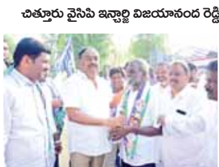
సమస్యలను అడిగి తెలుసుకుంటున్న డ్యూకం