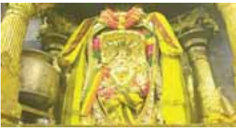
స్వామివారిని ఆలంకరించిన దృశ్యం