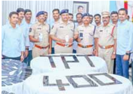
స్వాదీనం చేసుకున్న మొబైల్స్ను చూపుతున్న ఎస్పీ