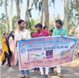
ర్యాలీ నిర్వహిస్తున్న డ్యూకం