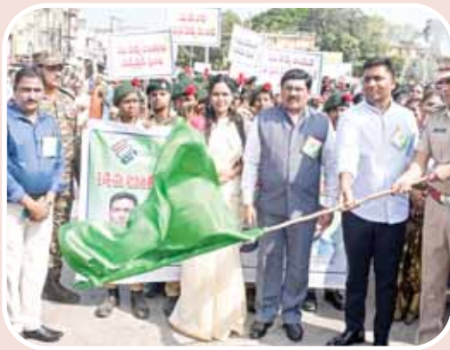
జెండా ఊపి కార్యక్రమాన్ని ప్రారంభిస్తున్న కలెక్టర్