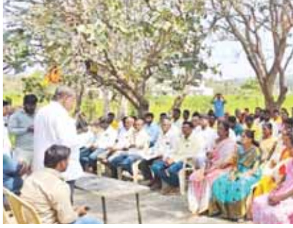
మాట్లాడుతున్న పార్టీ శ్రేణులు