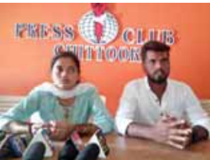
మాట్లాడుతున్న ప్రేమ జంట

చిత్తూరు అర్బన్, మేజర్ స్ట్యూన్: ప్రేమించి పెళ్లి చేసుకున్నాం రక్షణ కల్పించండి అంటూ గుడిపాల మండలం నరపాల పేట పోస్ట్ వసంతాపురం పంచాయతీ, చెరువు ముందర ఊరుకు చెందిన ఓ