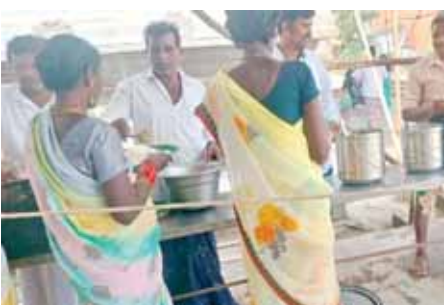
అన్నదానం చేస్తున్న దృశ్యం