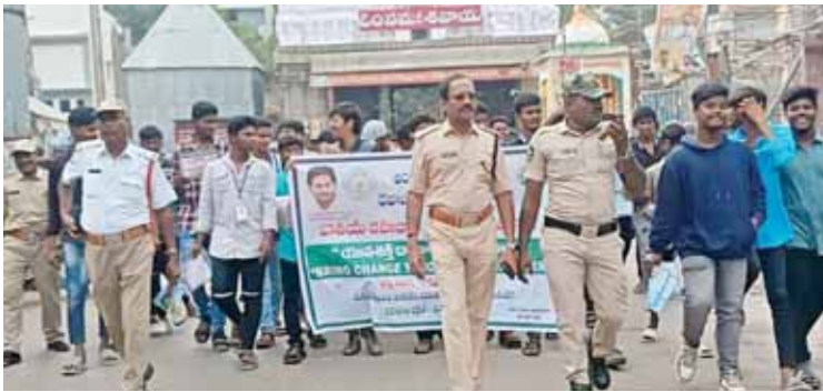
భద్రత దినోత్సవం ర్యాలీ నిర్వహిస్తున్న పోలీసులు, విద్యార్థులు