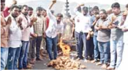
పంకాయలు కొడుతున్న యువగళం నేతలు