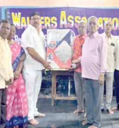
నీటిశుద్ధి యంత్రాన్ని అందచేస్తున్న దృశ్యం