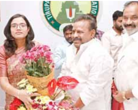
కమిషనర్ కు అభినందనలు తెలుపుతున్న సోయకులు

తిరుపతి కార్పొరేషన్, మేజర్ న్యూస్ : ప్రజా ప్రతినిధులు, అధికారులు, ప్రజల సహకారంతో తిరుపతి నగరాన్ని మరింత అభివృద్ధికి కృషి చేస్తానని నగరపాలక సంస్థ కమిషనర్ అతిథి సింగ్ తెలిపారు. కార్పొరేషన్ కార్యాలయంలో మంగళవారం అతిథి సింగ్ నగరపాలక సంస్థ సూతన కమిషనర్ గా బాధ్యతలు చేపట్టారు. సందర్భంగా మీడియాతో కమిషనర్ మాట్లాడారు. విశాఖపట్నంలో ట్రైని కలెక్టర్ గా, విజయవాడలో సబ్ కలెక్టర్ గా పని చేసిన తనకు నగరపాలక సంస్థ కమిషనర్ గా బాధ్యతలు