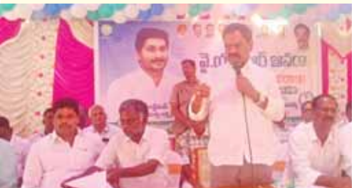
మాట్లాడుతున్న ఉపముఖ్యమంత్రి సో.కొ.యణస్వామి