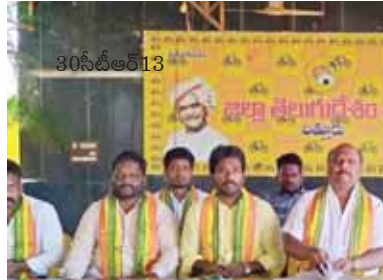
సమావేశంలో మాట్లాడుతున్న నాయకులు