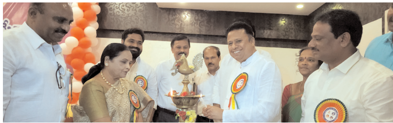
తిరుపతి, మేజర్ న్యూస్: