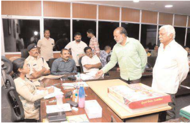
తిరుపతి కార్పొరేషన్, మేజర్ న్యూస్:

కార్పొరేషన్ పరిధిలోని అన్ని సచివాలయాల్లో జన్ భాగీధారి కార్యక్రమాన్ని నిర్వహించాలని ఈ నెల 19న విజయవాడలో 120 అడుగులతో ఏర్పాటు చేస్తున్న భారతరత్న డాక్టర్ బి.ఆర్ అంబేద్కర్ సామాజిక న్యాయ మహా శిల్పం సందర్భంగా ఈ నెల 10 తేదీన తిరుపతిలోని అన్ని సచివాలయాల్లో అంబేద్కర్ చిత్రపటాన్ని ఆవిష్కరించాలన్నారు. అంబేద్కర్ నిర్దేశించిన సామాజిక న్యాయమార్గంలో నడుస్తానని నేను ప్రతిజ్ఞ చేస్తున్నాను అని ఏర్పాటు చేసిన పైక్నిపై సంతకాలు పెట్టించాలని సూచించారు. అలాగే నగరంలోని అంబేద్కర్ విగ్రహాలను శుభ్రం చేసి, సుందరీకరణ పనులు చేపట్టాలన్నారు. సోషియల్ జస్టిస్ అవేర్ నెస్ తీసుకొచ్చేందుకు ఎస్సీ, ఎస్టీ వార్డుల్లో, వెనుకబడిన వార్డుల్లో కార్యక్రమాలు చేపట్టాలని, స్కూల్స్, కాలేజీల్లో క్విజ్, ఎస్సీ వ్రాయిటింగ్, డ్రాయింట్ నిర్వహించాలని సూచించారు. డయల్ యువర్ కమిషనర్ కు 18,