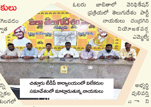
చిత్తూరు టీటీపీ కార్యాలయంలో విలేకరుల సమావేశంలో మాట్లాడుతున్న నాయకులు

చేపిచ్చి ఎన్నికల్లో గెలవడం జరిగిందన్నారు. అటు తర్వాత ఎమ్మెల్యే ఎన్నికలలో కనీసం ఏడవ తరగతి కూడా చదవని వ్యక్తులకు వట్ట బదులుగా చదివినారని ఓటు హక్కు కల్పించి ప్రజాస్వామ్యాన్ని ఖానీ చేశారు ఎన్నికల నిబంధనలను తుంగలో తొక్కారన్నారు. కేంద్ర ఎన్నికల కమిషనర్ ఆదేశాల మేరకు ఆంధ్రప్రదేశ్లో తప్పులు తడకలు లేని జాబితా తయారు చేయాలని ఆదేశాలు జారీ చేస్తే ఈ ఆంధ్రప్రదేశ్లో ఉన్నటువంటి వైసీపీ ప్రభుత్వం ఈ ప్రభుత్వంలోని అధికారులు కేంద్ర ఎన్నికల ఆదేశాలను ధిక్కరించి గడిచిన మూడు నెలల్లో