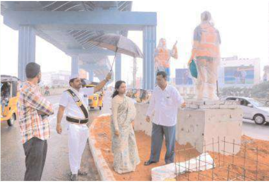
తిరుపతి కార్పొరేషన్, మేజర్ న్యూస్: