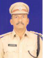
ఆంధ్రప్రదేశ్ హిస్టరీ కాంగ్రెస్ సంయుక్త కార్యదర్శిగా