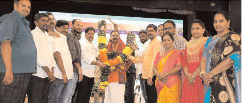
తిరుపతి కార్పొరేషన్, మేజర్ న్యూస్: