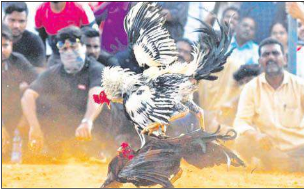
పెట్రోల్ బంక్ జనవాసాల మధ్యలో బరులు సంక్రాంతి సంబరాల ముసుగులో అసాంఘిక కార్యకలాపాలు చోద్యం చూస్తున్న పోలీస్, రెవెన్యూ యంత్రాంగం

జగ్గయ్యపేట డిసెంబర్ 12 మేజర్ న్యూస్ : మండలంలో సంక్రాంతి పండుగ ముసుగులో కొంతమంది అధికార పార్టీకి చెందిన కొంతమంది నాయకులు