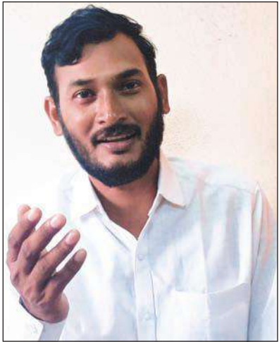
70 వేల కోట్ల రూపాయల ఎన్నో నిధులను దారి మళ్లించి 401 కోట్ల ఆ మహా శిల్పంతో మిమ్మల్ని