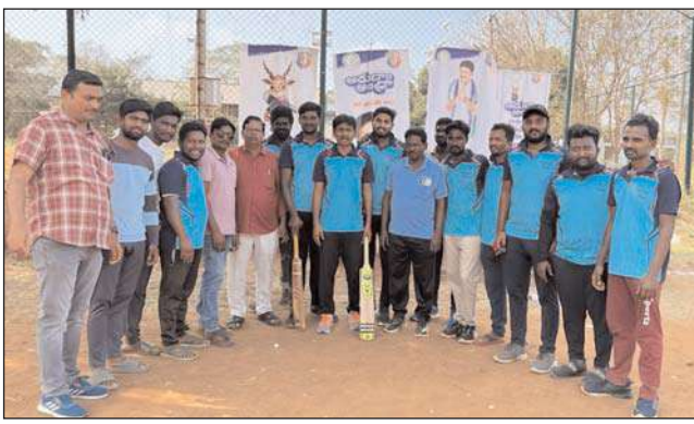
బ్యాటింగ్ కు దిగిన పెదకాకాని జట్టు 40 పరుగులకు కుప్పకూలడం గమనార్హం. ఫైనల్ ప్రతిభను నిరూపించుకోవాలని సూచించారు.

పెదకాకాని మేజర్ న్యూస్ : ఆంధ్రప్రదేశ్ రాష్ట్ర ప్రభుత్వం ప్రతిష్టాత్మకంగా నిర్వహిస్తున్న ఆడదాం ఆంధ్ర క్రీడా పోటీలలో నంబూరు సచివాలయం-3 వ జట్టు క్రికెట్ విభాగంలో విజయకేతనం ఎగరవేసింది. ఆదివారం ఆచార్య నాగార్జున విశ్వవిద్యాలయంలో జరిగిన క్రికెట్ ఫైనల్ మ్యాచ్లో పెదకాకాని జట్టుపై నంబూరు జట్టు గెలుపొందడం జరిగింది. మొదట టాస్ గెలిచి ఫీల్డింగ్ ఎంచుకున్న పెదకాకాని జట్టు పై నంబూరు జట్టు నిర్ణీత 10 ఓవర్లలో 64 పరుగులు చేసింది. 65 పరుగుల