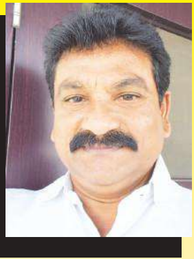
టీకెట్ ఇస్తారా? లేదా కుంపటి పెట్టిన నేతల మాట విని. గంజిని మార్చి కొత్త వారికి ఛాన్స్ ఇస్తారా? వేచి చూడాలి... 2 (మంగళగిరి, మేజర్ స్కూల్)

మంగళగిరిలో రసవత్తర రాజకీయం గంజికి గండి కొట్టే దిశగా అడుగులు పావులు కదుపుతున్న ఉడతా శ్రీను, కాంధ్రు కమల