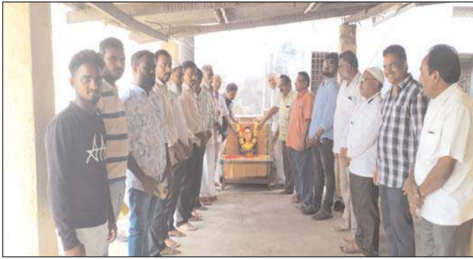
పొన్నూరు మేజర్ న్యూస్ : గొప్ప సంఘసంస్కర్త, ఉపాధ్యాయుని, రచయిత్రి, పాల్గొనడం జరిగింది.