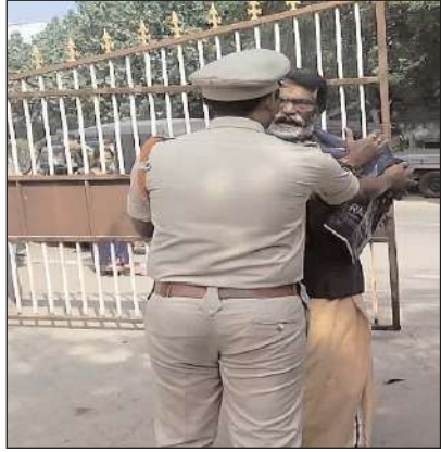
నందిగామ, జనవరి 3, మేజర్ న్యూస్: కలెక్టరేట్ ముట్టడి కి వెళ్తున్న అంగన్వాడీ వర్కర్స్ ను