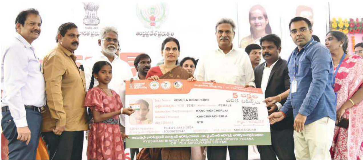
విశ్వగురుగా భారత్ ను నిలిపేందుకే..