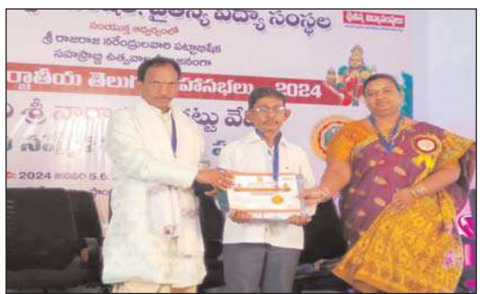
రోజులలో అంతర్జాతీయ తెలుగు మహాసభలలో

తెనాలిరూరల్, మేజర్ న్యూస్: రాజరాజ సరేంద్రుని పట్టణ్నిషేక సహస్ర నీ రాజున మహోత్సవాలను పురస్కరించుకుని ఆంధ్ర భాష సరస్వతపరిషత్, రాజమహేంద్రవరంలో జనవరి 6వ తేదీన నిర్వహించిన రెండవ అంతర్జాతీయ తెలుగు సభలలో రూరల్ మండలం కొలకలూరు గ్రామానికి చెందిన సాహితీ రత్న నూతక్కి పూర్ణ ప్రజ్ఞాచారి శనివారం పాల్గొన్నారు. సభ నిర్వహకులు సూచన మేరకు తెలుగు సారభం అను శీర్షికతో తన సీసపద్యములను పఠించటం జరిగింది. తెలుగు భాష వైభవం అంతరించిపోతున్న